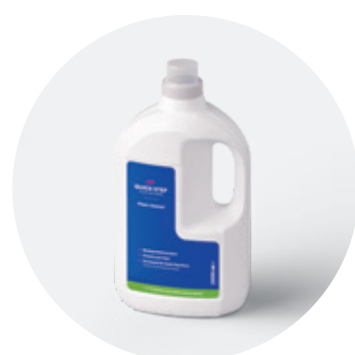
Floor Cleaner 1 L o 2 L QSCLEANECO1000 QSCLEANECO2000