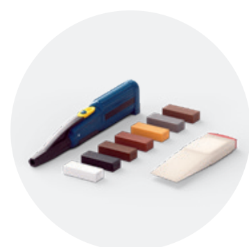
Kit di riparazione QSREPAIR