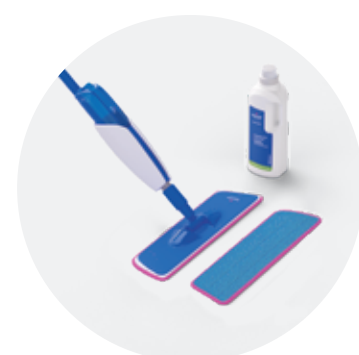
Kit per la pulizia QSSPRAYKIT