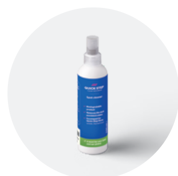
Spot Cleaner 250 ML QSSPOTCLEAN